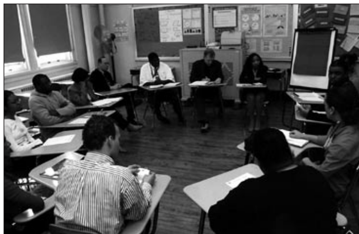
Los miembros de GLOBE se reúnen con los directores de las escuelas secundarias del área para discutir los problemas de la homofobia en las escuelas.

Además del trabajo a nivel local para proveer a estudiantes GLBT con una experiencia educativa más positiva, GLOBE trabaja de la mano con otras organizaciones del estado de Nueva York, al ser miembro de la Coalición de Dignidad para Todos los Estudiantes Unidos. Esta coalición está trabajando en pasar una ley que le exige a las escuelas dar entrenamiento a los pro-