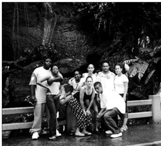
Los miembros y trabajadores del Proyecto Juvenil viajaron a Vieques, Puerto Rico para explorar la presencia militar estadounidense en esa region.

El pasado mes de enero, dos docenas de participantes del poder juvenil, acompañados por otros miembros de Se Hace Camino al Andar, viajaron a Carolina del Sur en el estado de Columbia para encargarse de que los candidatos a la presidencia por el partido demócrata escucharan las necesidades de las comunidades de color de bajos ingresos como lo es Bushwick. El viaje, patrocinado por la organización nacional, Centro Para el Cambio de la Comunidad, reunió cientos de líderes comunitarios de todo el país