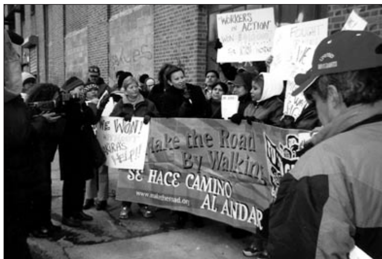
Miembros del Proyecto de Trabajadores de Se Hace Camino al Andar protestan junto a la congresita Nydia Velazquez durante el anuncio del acuerdo de Danmar.