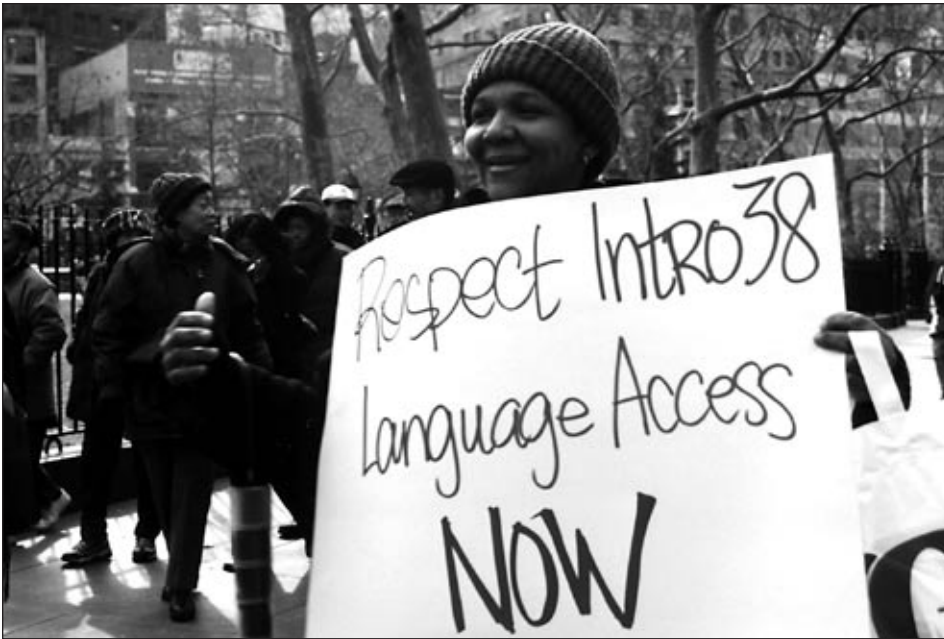
Miembros de Se Hace Camino al Andar exigen acceso en español en oficinas locales de Medicaid, estampas de comida y centros de beneficencia.