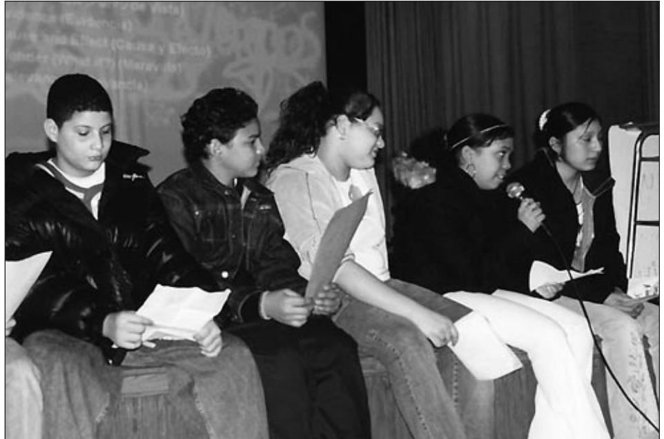
Los estudiantes de la escuela secundaria de Bushwick para Justicia Social representándose en su reunión semanal sobre Justicia Social llamada "Town Hall."

Dado el compromiso de Se Hace Camino al Andar en desarrollar capacidad de liderazgo dentro de sus miembros, continuamos invirtiendo en entrenamiento para hacer de nuestros miembros líderes y representantes comunitarios. En los últimos meses, 20 miembros se han graduado del taller de un día en entrenamiento de líderes, llamado: "Encuentro de Líderes". El taller ayuda a nuestros miembros a desarrollar capacidades de liderazgo y a crear conciencia de lo importante que es la participación de cada uno en la lucha por la justicia social.